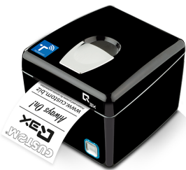
913FF030100733 Q3X-F RT ETH USB NERO TELEMATICA