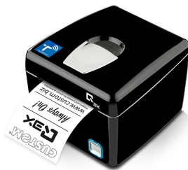
913FF030100N33 Q3X-F RT WIFI ETH USB NERO TELEMATICA